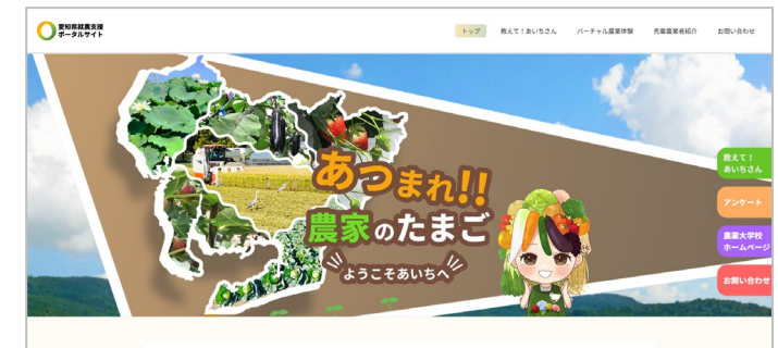
トップページ (農起業支援ステーション)